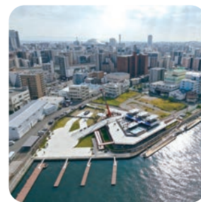
中之島GATEターミナル

京阪中之島駅直結の総水空間。水上レストランにレザー&アパレルブランドの旗艦店やバー、カフェが点在。クルーズサービスも。