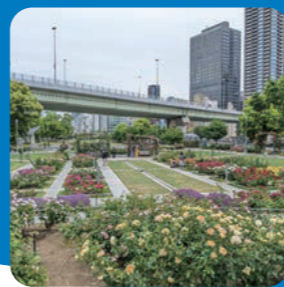
バラ園 (中之島公園)