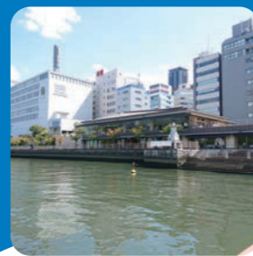
川の駅はちげんや

水都大阪を代表する水辺の情報発信施設。1階にはレストラン、地下にはレンタル＆コミュニティスペース「ステーションB」がある。