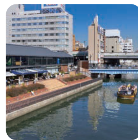
キャナルテラス堀江

道頓堀川沿いに2004年12月に誕生した遊歩道。様々なイベントが行われ、川沿いに多くの飲食店が並んでいる。