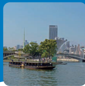
剣先噴水 (中之島公園)