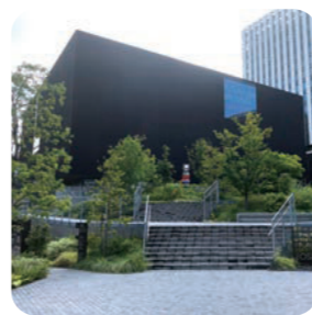
大阪中之島美術館