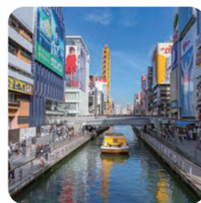
どんぼりリバーウォーク

道頓堀川沿いに2004年12月に誕生した遊歩道。様々なイベントが行われ、川沿いに多くの飲食店が並んでいる。