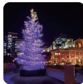
水辺のシンボルツリー (中之島公園水上劇場前)