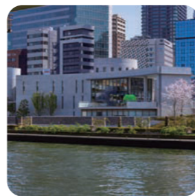
こども本の森 中之島