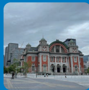
大阪市中央公会堂