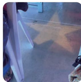
ラッキースター (天満橋下)