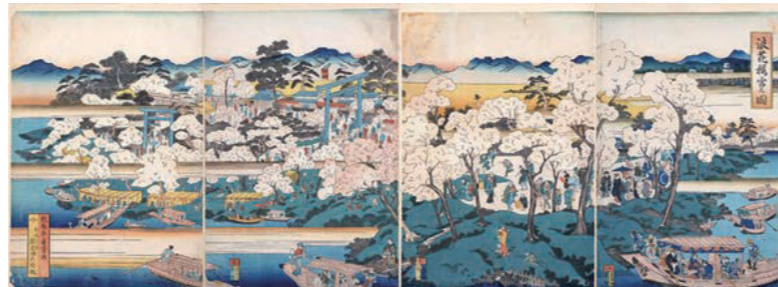
「桜宮」は日本最古の桜の名所であり、陸からも船からも、桜を愛でることができた。 (出典：錦絵「浪華百景」の図）作・魁春亭貞芳／国立国会図書館デジタルコレクションより）

見、納涼、お月見など四季折々の水辺に親しんできました。提言し、環境水準の目標や、水上バスの運営、道頓堀川沿いの遊歩道化などが実現しています。2001年、大阪府、大阪市、経済界がともに提案した「水の都大阪再生構想」が都市再生プロジェクトに採択され、21世紀にふさわしい水辺の魅力づくり、水都再生が加速しました。水の都大阪再生構想は、中之島、東横堀川、道頓堀川、木津川からなるの字の川を「水の回廊」として再生し、大阪全体の活性化を目指すものでした。さらに、2011年に河川空間の利用に係る規則が緩和されたことにより、水辺でカフェや川床、オープンテラスなどの営利活動もできるようになり、水辺のにぎわい空間が次々と生まれました。大阪市の市章「澤標」は、船が安全に航行できるよう、河口に立てられた航行標識です。大阪の繁栄は昔から水運と出船入船に負うところが多く、人々に親しまれ、港にもゆかりの深いことから明治27年、市章に選ばれました。現在、大阪のまちに流れる水の都のDNAは、脈々と受け継がれ、大阪の暮らしの中に水辺の新しい歳時記が復活され、住みたい、訪れたい、魅力的な都市として新たな進化を続けています。