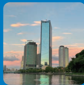
大阪ビジネスパーク